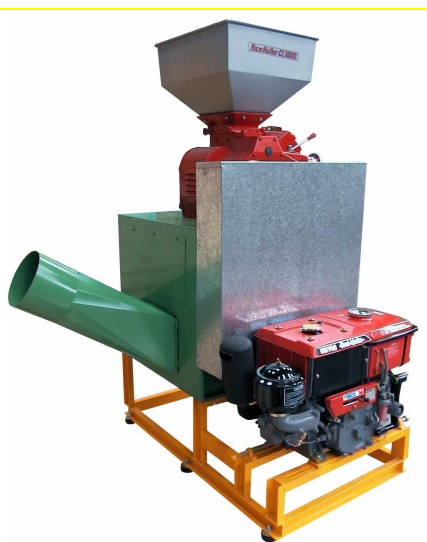
DECORTIQUEUR A ROULEAUX CL 1000 VERSION THERMIQUE