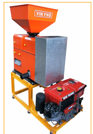
POLISSEUR BLANCHISSEUR CCB 700 VERSION THERMIQUE