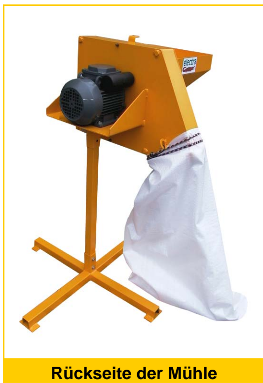
Rückseite der Mühle