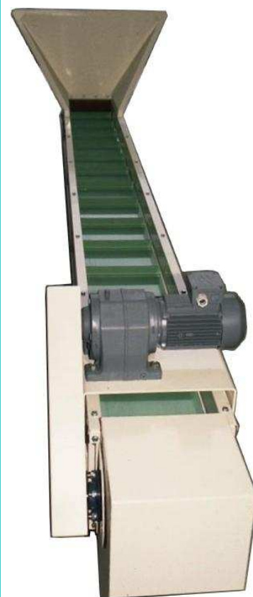
Pour les granulés