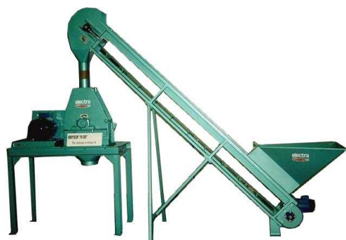
Pour une alimentation régulée des broyeurs